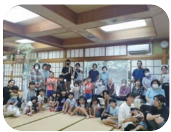
【インターナショナルたちま】