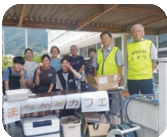
【コーヒー飲みに来んかな〜(玉津)】