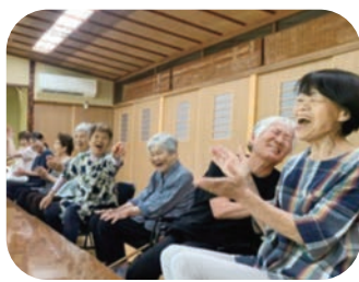
【お楽しみサロン(河内中)】