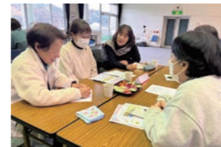
はじめての傾聴講座