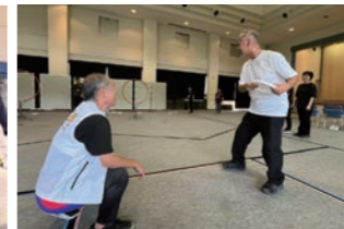
障がい者スポーツ体験講座