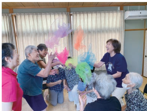
ミュージックケアではたくさん笑いも!