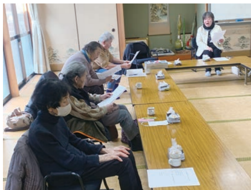
講師を迎え、「歌の時間」を楽しみました♪