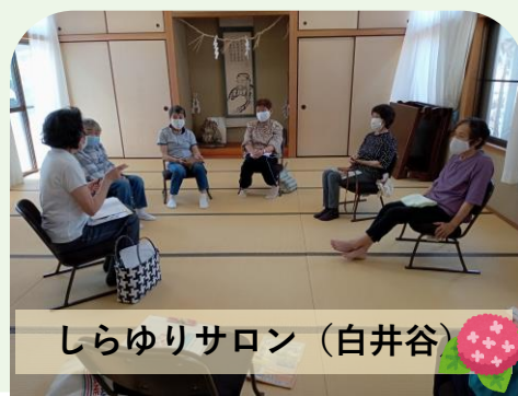
しらゆりサロン（白井谷）